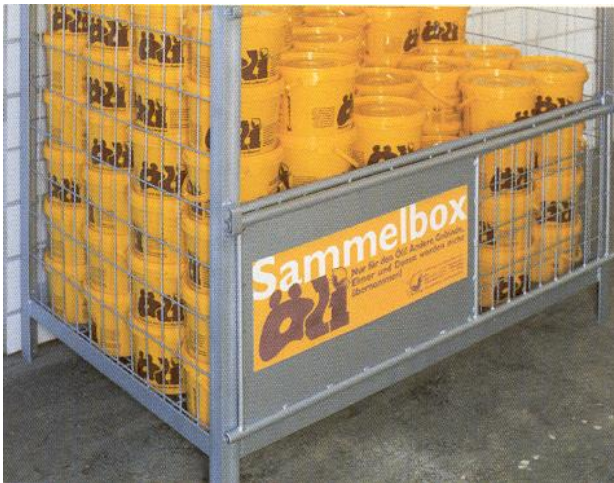
Die Öli-Sammelbox am Wertstoffhof